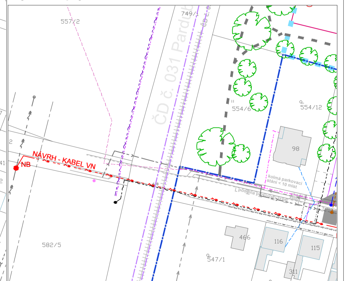
Výřez - napojení kabelového vedení VN M 1:1000